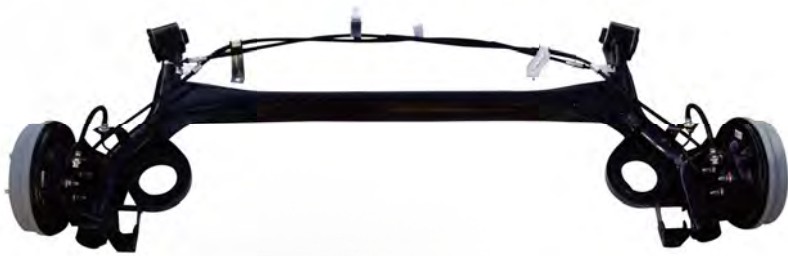
Rear Horizontal Suspension Module